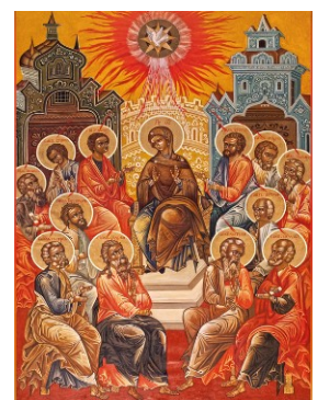
"Abiterò nella casa del Signore"